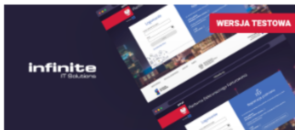
Aplikacja testowa Infinite IT Solutions

W razie problemów i pytań związanych z zakładaniem lub użytkowaniem konta należy skorzystać infolinii Brokera oraz przygotowanej przez każdego z nich instrukcji obsługi. Dane kontaktowe znajdują się na dole strony z informacjami o Brokerze: